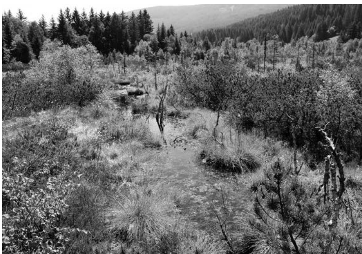
Abb. 4. Flugplatz der Großen Moosjungfer im östlichen Saumoos: Ein bis zu ca. 2 m breiter, aufgestauter Graben mit gut strukturierter, vorwiegend kurzer Ufervegetation (Foto: P. Gros).

verhältnismäßig gut erhaltenes Hochmoorgebiet, dessen Randbereiche teilweise aus extensiv beweideten Niedermoorflächen bestehen. Seine Fläche beträgt etwa 20 ha.