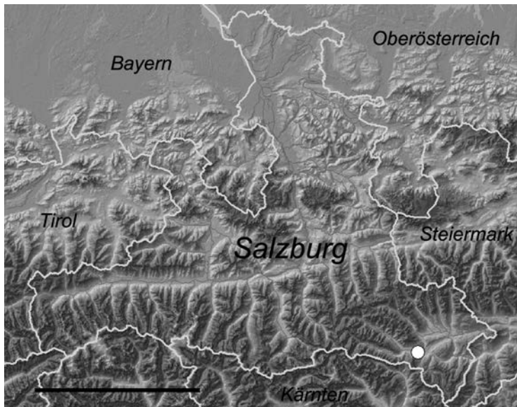
Abb. 2. Lage des Saumoos im Bundesland Salzburg (weißer Kreis). Darstellung auf Basis der Quadranten 3' x 5' der österreichischen Messtischblätter (Maßstab: 50 km).