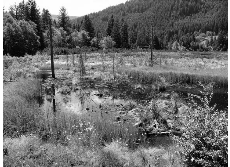
Abb. 5. Flugplatz der Großen Moosjungfer im nördlichen Saumoos: Großflächiger Moorweiher mit kurzer Ufervegetation.

Die Beobachtung mehrerer Individuen von L. pectoralis an gleich zwei verschiedenen Stellen lässt den Schluss nahe, dass das Vorkommen im Saumoos bodenständig sein könnte. Dies bedarf jedoch noch der konkreten Bestätigung. Das Vorkommen ist aufgrund der Meereshöhe (1.035 müA) jedenfalls bemerkenswert, bedenkt man, dass L. pectoralis eine beinahe ausschließlich in tieferen Lagen verbreitete Art ist. Den Schwerpunkt der österreichischen Verbreitung bilden niedrig gelegene Gebiete im Burgenland, Wien und Niederösterreich. Nach RAAB et al. (2006) sind die bislang höchsten Fundorte in Österreich das St. Lorenzener Hochmoor in Kärnten (1.450 müA) und das Reither Moor bei Seefeld in Tirol (1.180 müA).