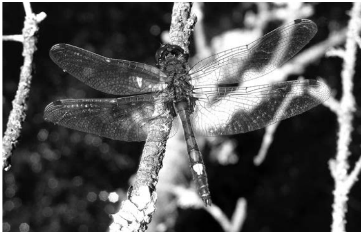
Abb. 3. Männchen der Großen Moosjungfer ( Leucorrhinia pectoralis) aus dem Saumoos, Lungau, 6.06.2015.